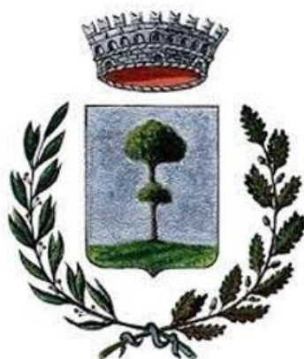
Comune di Sabbioneta