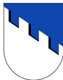
Comune di Castelrotto