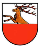
Comune di S.Cristina